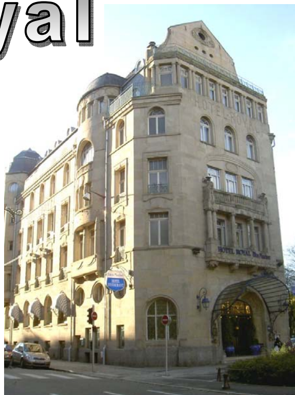
Avenue Foch, au cœur de la ville de Metz