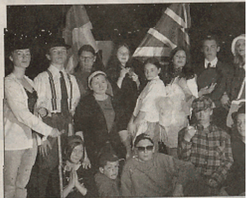
La troupe Show'Bise au grand complet.

● Trois langues deux chats ce soir à 20 h 30 au théâtre municipal d'Epinal. Entrée 5 €. Gratuit pour les -14 €