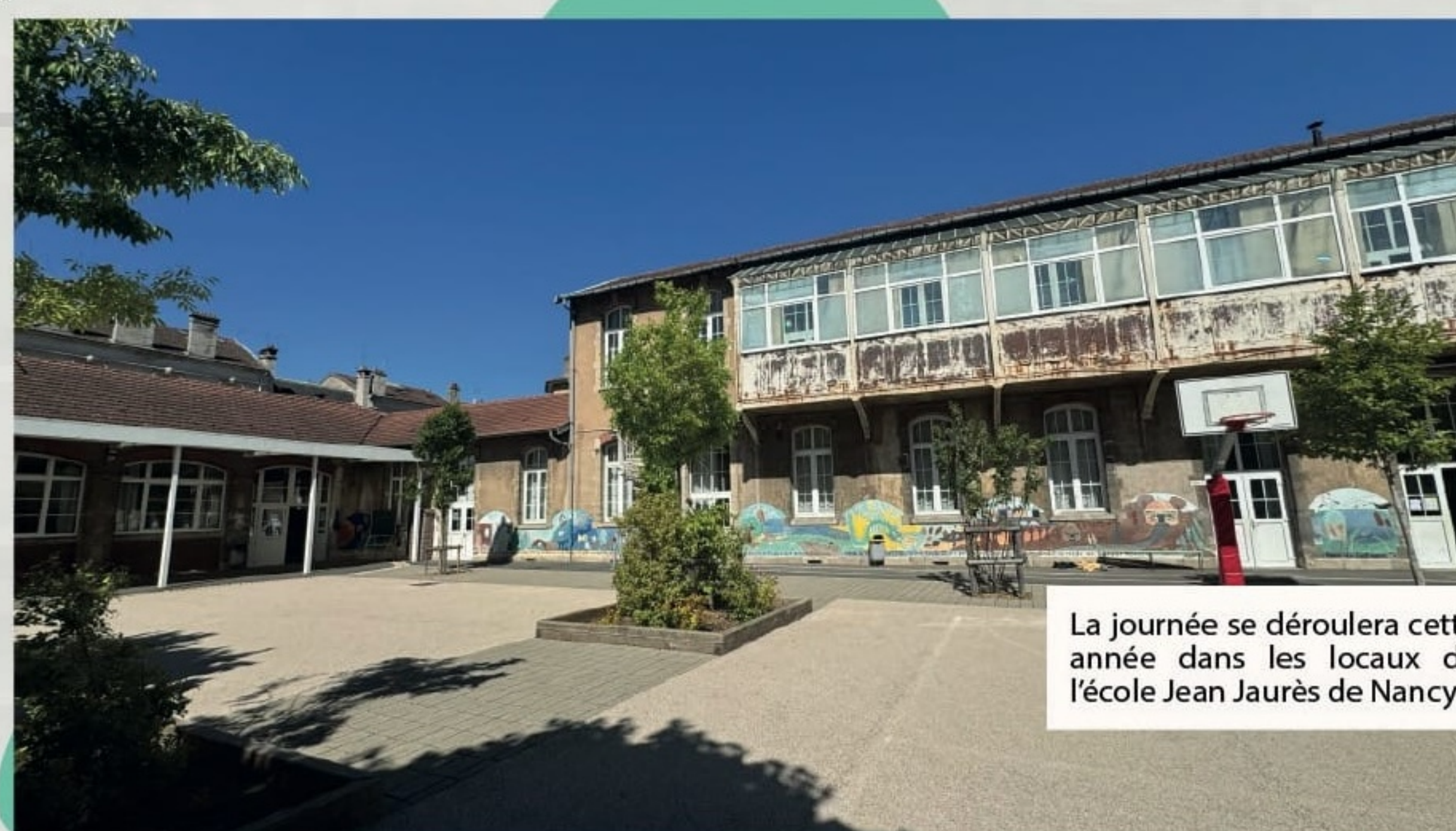
La journée se déroulera cette année dans les locaux de l'école Jean Jaurès de Nancy

Destinée à mettre à l'honneur les projets innovants sélectionnés par le jury académique, tout en étant en contact direct avec des chercheurs, la journée académique de l'innovation se déroulera le 13 mai prochain. Des ateliers, des conférences, des échanges sont prévus, notamment en présence des enseignants porteurs des projets primés.