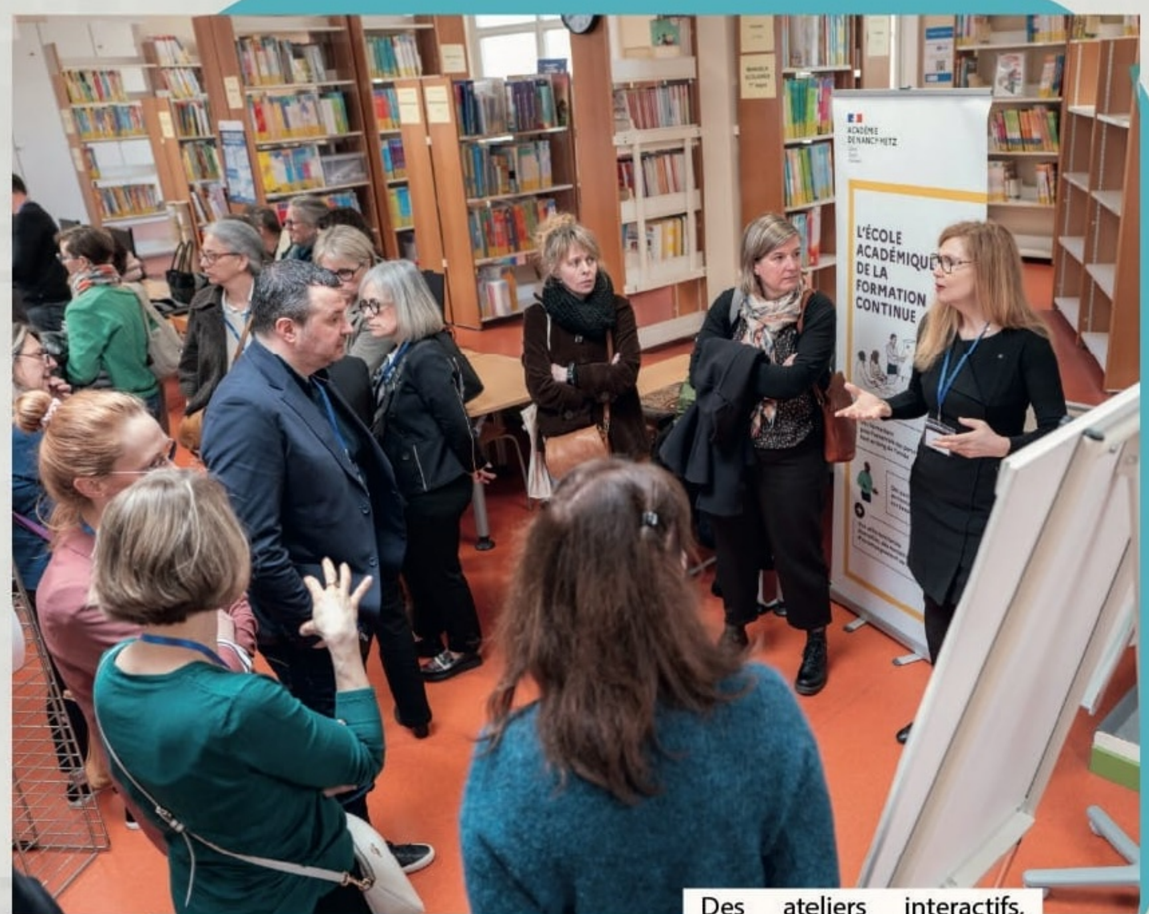
Des ateliers interactifs, thématiques mais aussi des sessions posters étaient proposés ce jeudi...