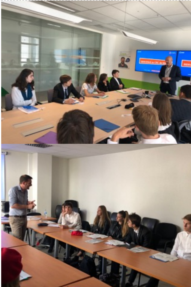
Journée d'intégration Seconde CVAI, intervention de professionnels.