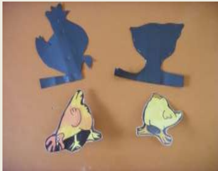
Ombres et silhouettes maracas